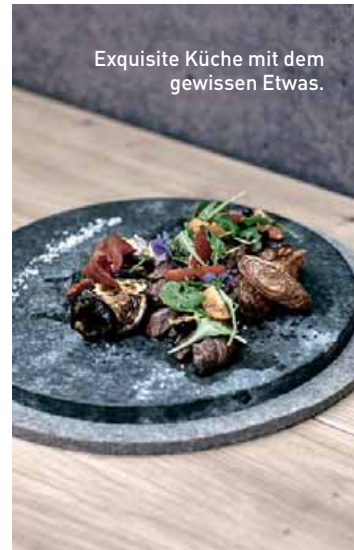
Exquisite Küche mit dem gewissen Etwas.