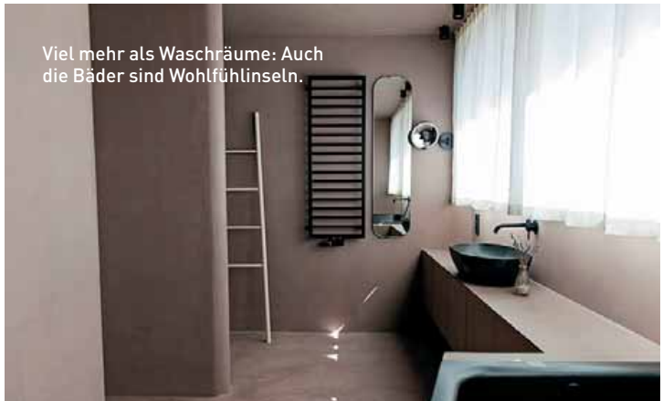
Viel mehr als Waschräume: Auch die Bäder sind Wohlfühlinseln.