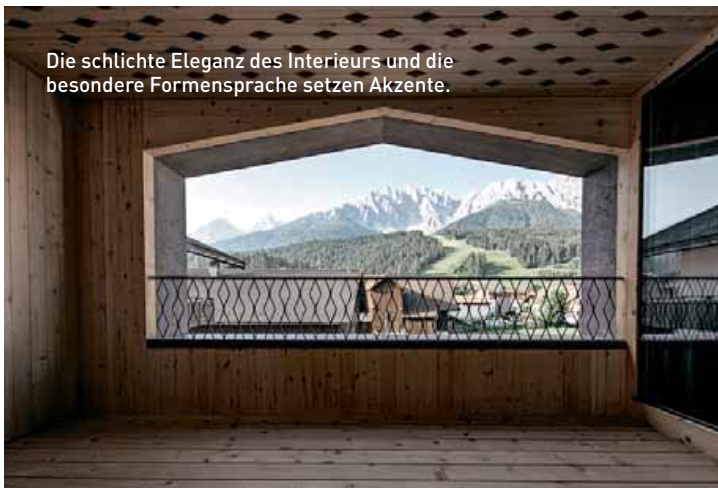
Die schlichte Eleganz des Interieurs und die besondere Formensprache setzen Akzente.