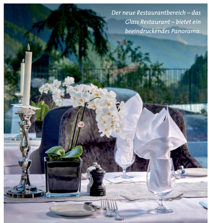
Der neue Restaurantbereich – das Glass Restaurant – bietet ein beeindruckendes Panorama.

Der neue Restaurantbereich – das Glass Restaurant – bietet ein beeindruckendes Panorama auf den Outdoor-Wellnessgarten und die Almen. Besonders schön ist das Farbenspiel der Gsieser Berge bei Sonnenuntergang. Das Feeling an der Hotelbar wurde noch ansprechender: Die Hotelbar wurde modernisiert, und eine neue Rum-Lounge entstand.