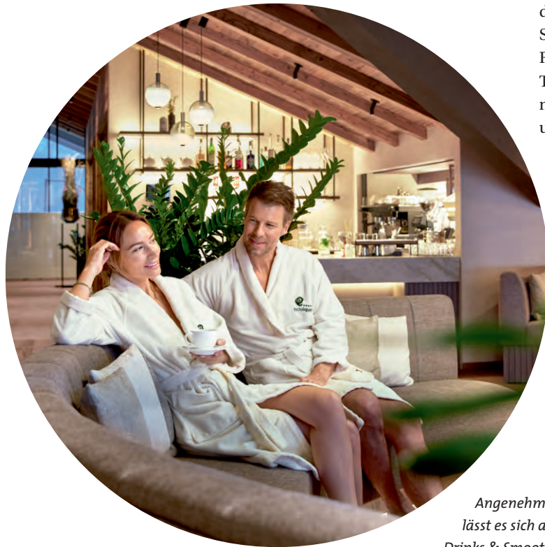
Angenehm entspannen lässt es sich an der Clouds 7 Drinks & Smoothie Bar.

erfüllen höchste Ansprüche von Saunabegeisterten. Dazu kam die neue Infrarot-Relaxsauna – wohl-tuende Wärme mit beeindruckenden Ausblicken auf die Bergwelt. Stille, die Körper und Geist zur Ruhe kommen lässt, bieten im Timeless Sky SPA insgesamt 80 neue Liegemöglichkeiten innen und outdoor mit zwei Silence Rooms, davon einer mit offenem Kamin und einer großen Outdoor-Terrasse. Die Cloud 7 Drinks & Smoothie Bar mit Lounge bietet kleine Snacks und Getränke für zwischendurch. Aber nicht nur das: Hier finden auch besondere Eventabende unter dem Sternenhimmel statt.