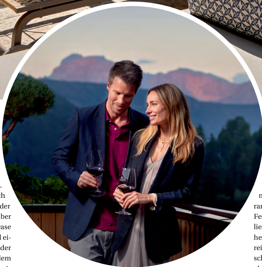
Der perfekte Treffpunkt zu zweit: die Rooftop-Terrasse.

Den Luxus von Wellness in den eigenen vier Wänden werden Gäste des Fünf-Sterne-Hotels Quelle künftig in den beiden neuen Openspace-Wellness-Suiten erleben. Wohnräume für alle, die sich mehr gönnen möchten. Jede der Sky Loft & SPA Suites verfügt über eine völlig private Wellness-Oase mit Whirlpool im Zimmer und einem Outdoor-Whirlpool auf der privaten Dachterrasse unter dem Sternenhimmel. Von der finnischen Sauna mit Panoramablick bis hin zum großen Kuschelbett, Luxusbadezimmer und Romantic Fire im Wohnbereich bieten die neuen Suiten privaten Wohn- & Wellnesskomfort auf höchstem Niveau. Weitere neue Wohnräume