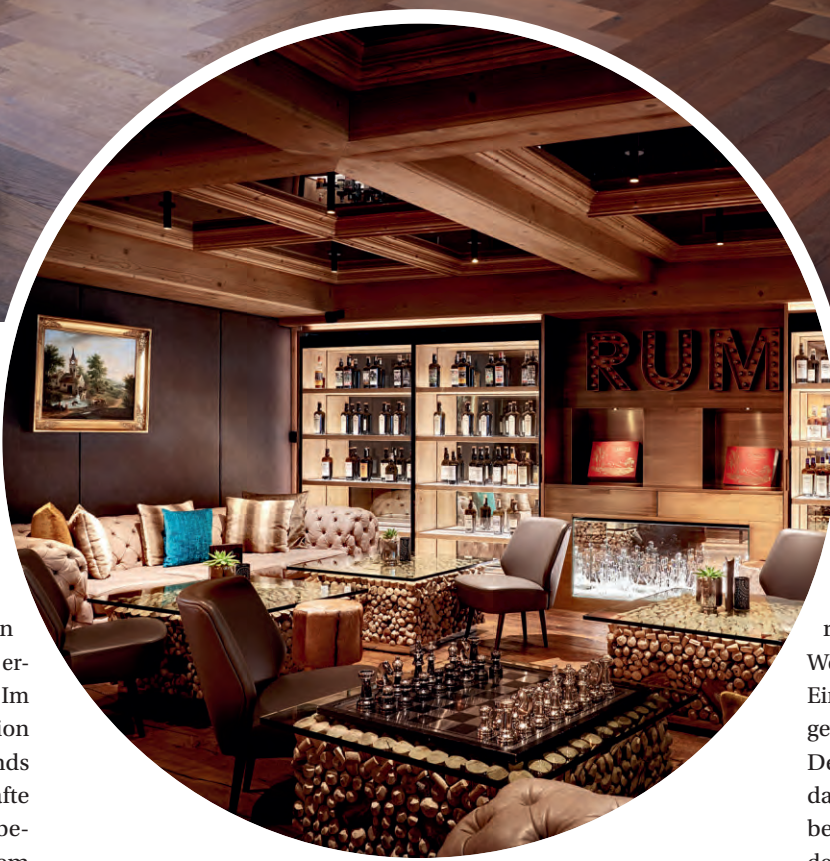
Die Hotelbar wurde modernisiert, und eine neue Rum-Lounge entstand.