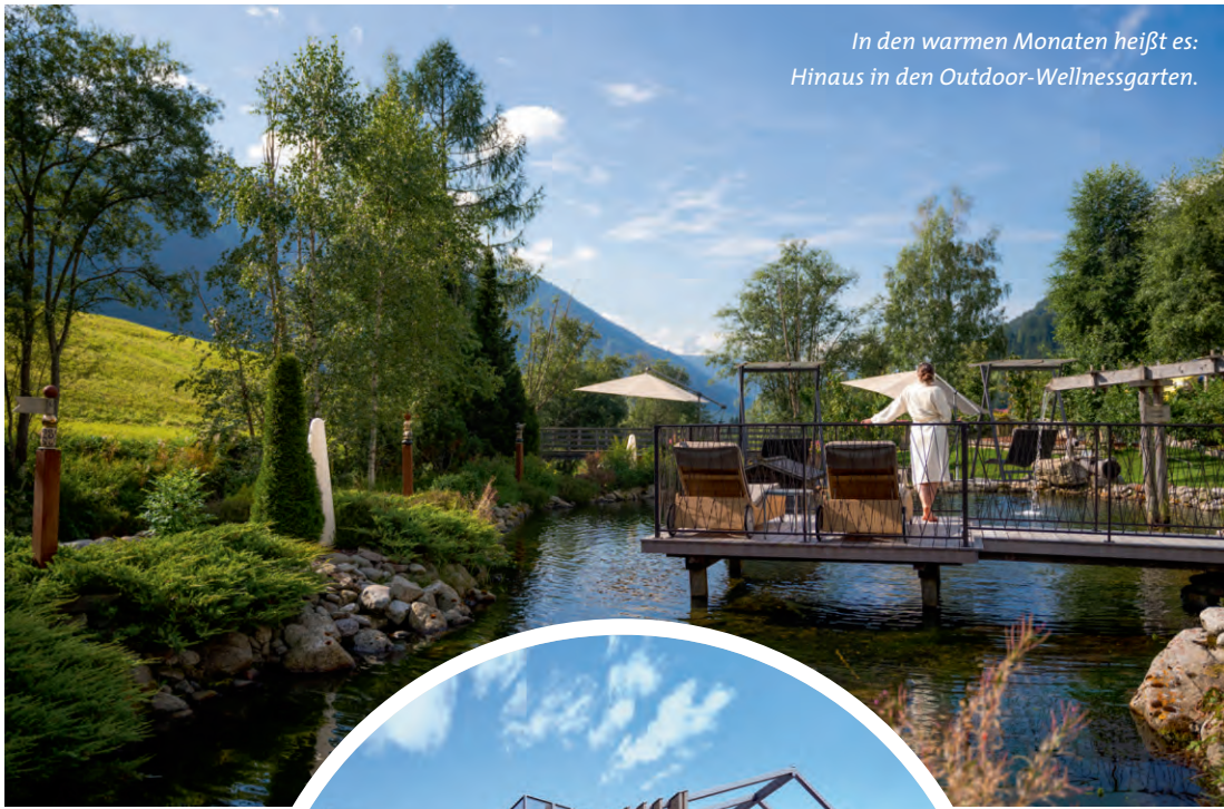
In den warmen Monaten heißt es: Hinaus in den Outdoor-Wellnessgarten.

Für stille Naturerobere stehen Schneeschuhe bereit und auch Skitourengeher finden sich an einem zentralen Ausgangspunkt in die Berge. An sechs Tagen in der Woche hat man die Wahl aus mehreren geführten Outdoor-Erlebnissen, die in bester Erinnerung bleiben. Magische Schneeschuhtouren, Winterwanderungen für die ganze Familie, lustige Rodelpartien, kostenlose Langlaufkurse für Anfänger und Fortgeschrittene, geführte Skitage, Wintererlebnisse am Pragser Wildsee, Familienwanderungen, Winter-Run und Fitness-Indoor-Workouts, Energy-Walks mit Yoga – die Hotel-Guides zeigen alle Facetten, die der Winter im Gsieser Tal spielt.