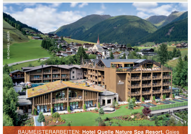
BAUMEISTERARBEITEN: Hotel Quelle Nature Spa Resort, Gsies

ST. LORENZEN Tel. +39 0474 474 063 www.gasserpaul.it