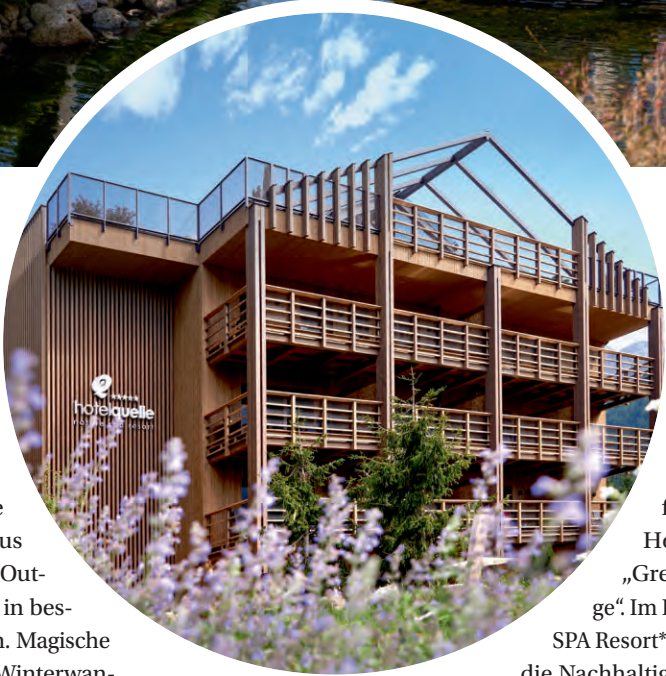
Seit diesem Sommer ist auch die Außenfassade neu.

Ich mach' mir die Welt, wie sie mir gefällt ... Im Hotel Quelle Nature SPA Resort***** ist die Welt für Familien ein bisschen bunter. Neben geräumigen Suiten zum Rundum-Wohlfühlen bietet das Hotel Wellnessgenuss für Familien im Indoor-Pool, im Panoramafreibad und Badeteich, in Dress-on-Saunen und im Relaxraum. Der neue Kids Club mit Players Lounge auf 120 m 2 begeis-