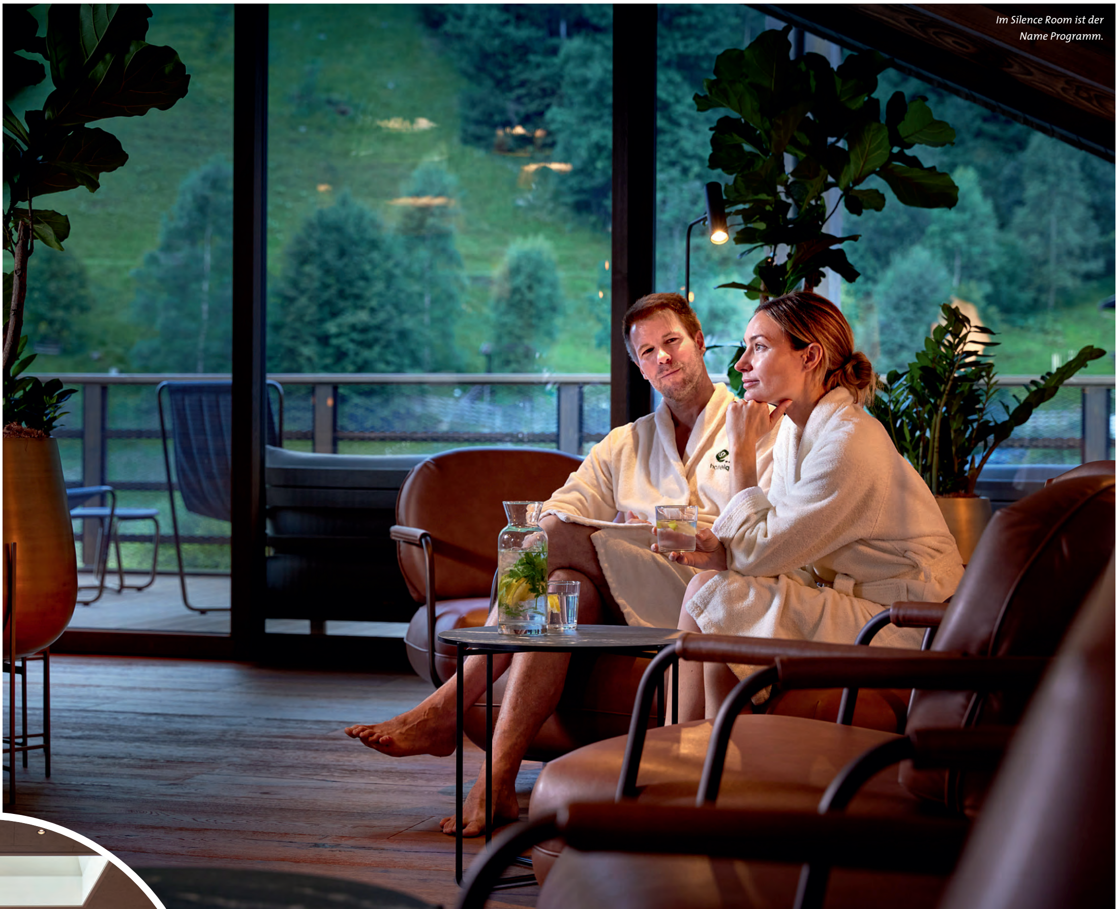
Im Silence Room ist der Name Programm.