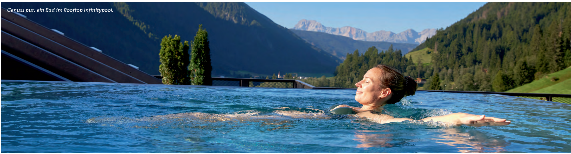
Genuss pur: ein Bad im Rooftop Infinitypool.