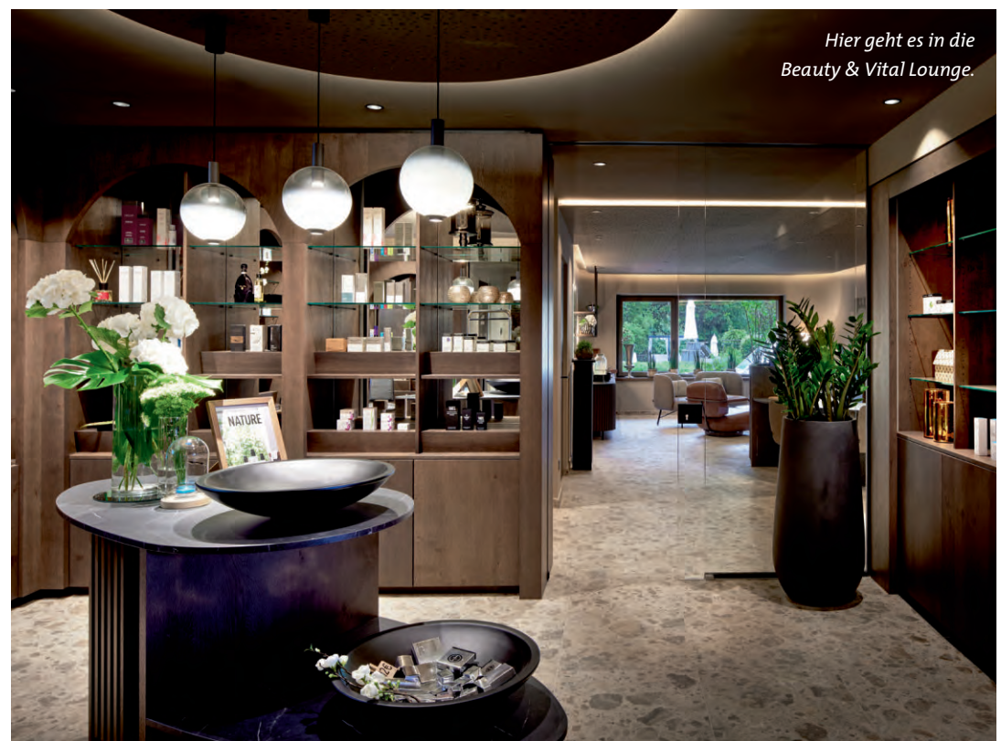
Hier geht es in die Beauty & Vital Lounge.

Das Gsieser Tal ist Teil von Dolomiti Nordic Ski, Europas größtem Langlaufkarussell mit herrlichen Touren inmitten der Dolomiten. Der Hotel-Shuttle fährt die Skifahrer bequem zum kleinen Dorflift oder zu Südtirols Skigebiet Nummer eins, dem Kronplatz.