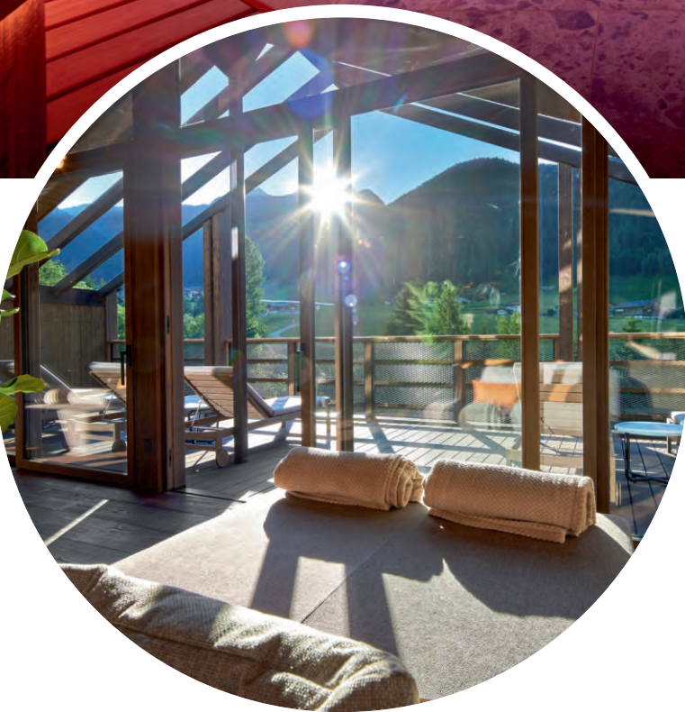
Ein Blick in den Mountain Fire Silence Room.

Der „Luxury Wellness & SPA“, aufgeteilt in fünf Bereiche mit insgesamt acht In-/Outdoor-Pools, zwölf Themensaunen sowie sieben Relax- und Ruhezone ist Ihr Rückzugsort zum Abschalten und Energie tanken. Genießen Sie den 20-Meter-Infinity-Outdoor-Sportpool im Nature SPA, schweben Sie schwerelos in der Sole-Salzwassergrotte und relaxen Sie in einem der traumhaften Outdoor-Whirlpools. Spüren Sie die wohltuende Wärme unserer verschiedenen Saunaoasen mit getrennten Nackt- und Dress-on-Familien-Saunen, Infinity-Aufguss-Sauna, einzigartiger